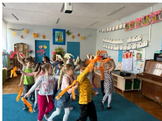
Żywiot – ogień