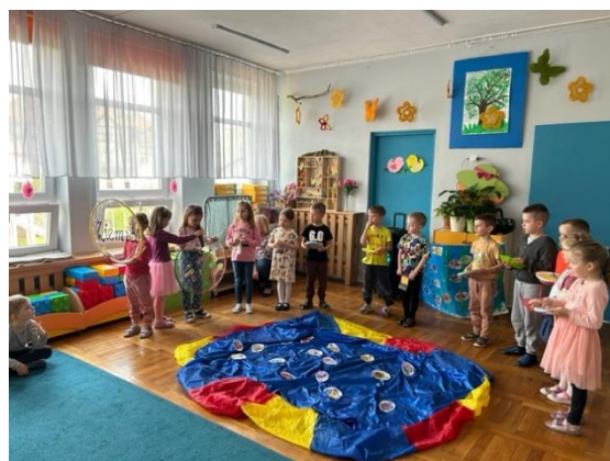
Żywiot - ziemia