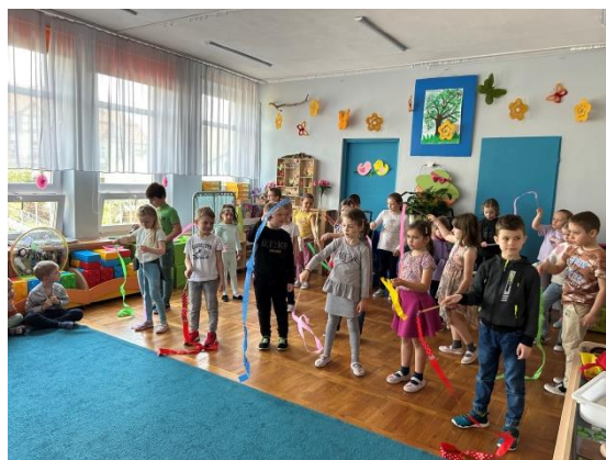
Żywiot - powietrze