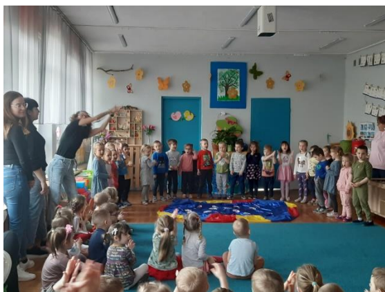
Żywiot – woda

Ostatnie działanie to „ Żywiotowe prezentacje ” – spotkaliśmy się wszyscy w jednej Sali i każda z grup prezentowała nam swój żywiot, opowiadając o nim poprzez piosenki, taniec, wiersze, opowieści o skarbach ziemi. Tak się prezentowaliśmy: